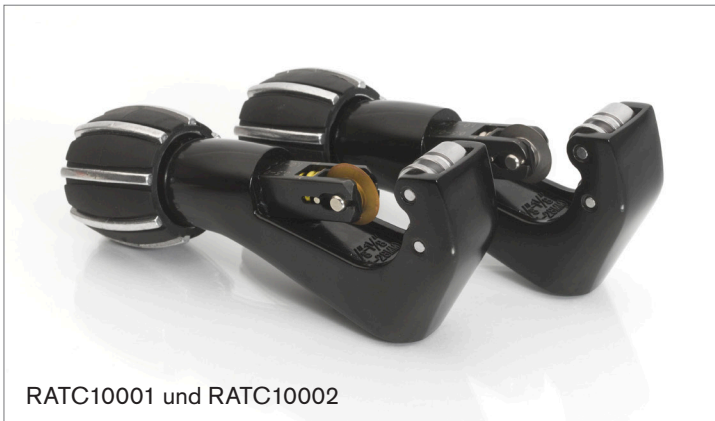
RATC10001 und RATC10002

CHILLVENTA Robinair auf der Chillventa in Nürnberg 13. - 15.10.2010 Halle 2 / Stand 2-516